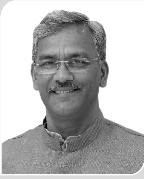
त्रिवेन्द्र सिंह रावत मुख्यमंत्री, उत्तराखण्ड